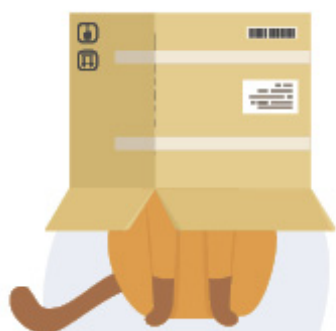
گربه زیر جعبه است.