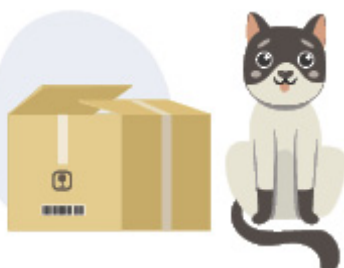
گربه پهلوی جعبه است.