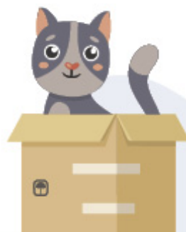
گربه توی (داخل) جعبه است.