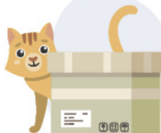
گربه پشت جعبه است.