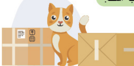
گربه بین جعبه ها است.