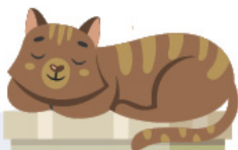
گربه روی جعبه است.