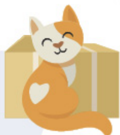
گربه جلوی جعبه است.